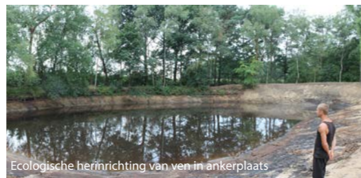
Ecologische herinrichting van ven in ankerplaats

Er werden 6 waterpartijen hersteld of nieuw aangelegd: zowel nieuwe poelen zagen het licht als enkele voormalige visvijvers werden ecologisch omgevormd.