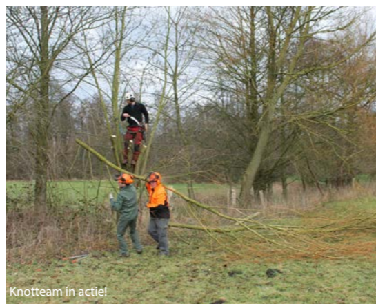
Knotteam in actie!

De vrijwilligers van ons knotteam beheerden opnieuw heel wat knotbomen en houtkanten en een PDPO-project rond beheer van houtkanten in agrarisch gebied ging van start. Het LEADER-project rond de voormalige landbouwkolonie Malou in Balen werd afgewerkt en meteen werd een vervolg gepland. 86 landbouwers in ons werkingsgebied sloten een beheerovereenkomst af voor in totaal 538 objecten.