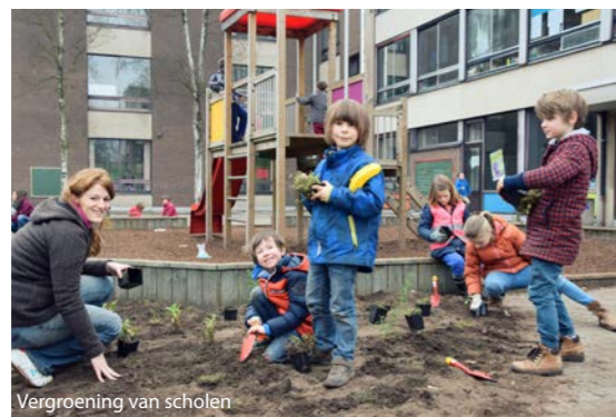
Vergroening van scholen

Zoals elk jaar kregen ook dit jaar drie scholen in ons werkingsgebied een groene make-over, ditmaal in Balen, Turnhout en Herentals.