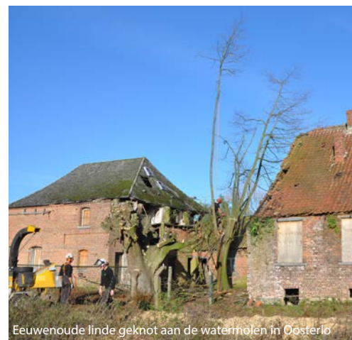
Eeuwenoude linde geknot aan de watermolen in Oosterlo

Bijna 35 hectaren fauna-akkers werden opnieuw ingezaaid in samenwerking met wildbeheereenheden en landbouwers. Niet alleen mooi in het landschap, maar ook nog eens goed voor de biodiversiteit!