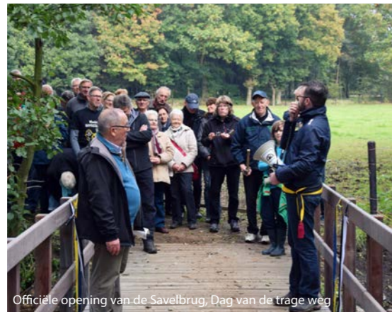
Officiële opening van de Savelbrug, Dag van de trage weg

Ook qua recreatie en natuurbeleving zaten we niet stil. Het trage wegenplan voor de gemeente Olen is bijna afgewerkt en in Geel zijn we halfweg, mede dankzij de hulp van een dertigtal vrijwilligers! Het LEADER-project rond trage wegen in de Zuiderkempen werd afgewerkt, met onder meer de plaatsing van twee fiets- en wandelbruggen.