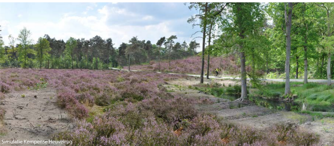
Simulatie Kempense Heuvelrug

Voor de Kempense Heuvelrug tussen Kasterlee en Lichtaart maakten we een landschapsbiografie toeristisch ontwikkelingsplan. Op basis van dit plan voorzien we de uitvoering van een aantal acties in 2016. Verder willen we het plan uitbreiden naar alle (vier) gemeenten die op de Kempense Heuvelrug liggen.