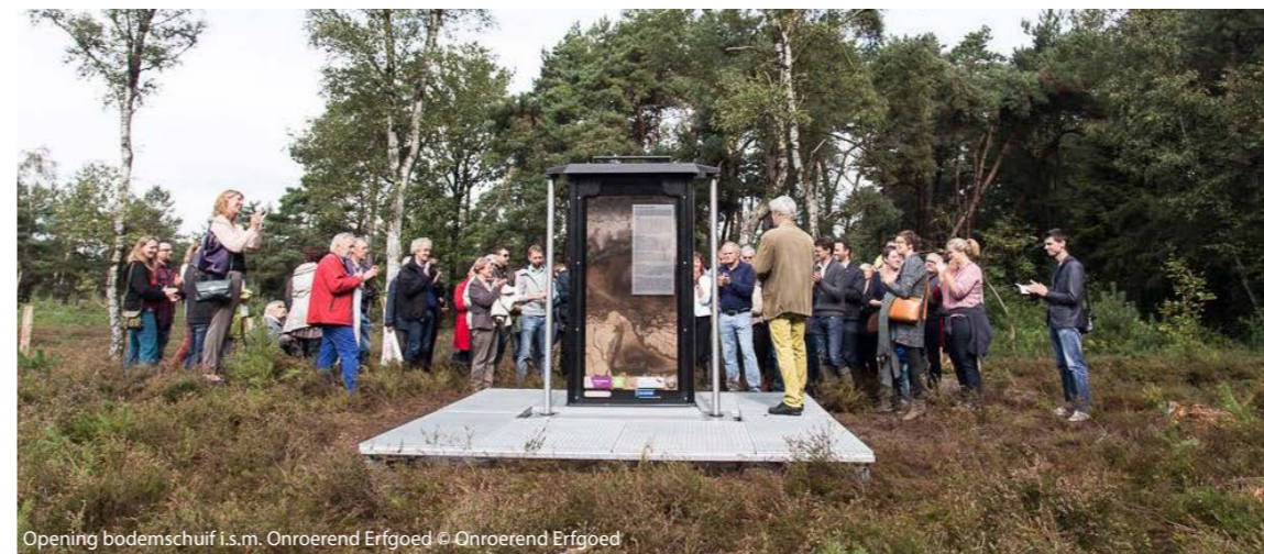
Opening bodemschuif i.s.m. Onroerend Erfgoed

Zoals elk jaar werden duizenden mensen betrokken bij de werking van RLKGN via workshops, cursussen, wandelingen, etc. In de omgeving van het ecodeuct Kempengrens in Mol-Postel wordt met alle gebruikers van de open ruimte gezocht naar kansen voor natuurherstel. De nieuwe fietsbrochure Sporen in het Zand geeft fietsers in drie thematische lussen heel wat historische weetjes en achtergrondinfo over de Zuiderkempen mee. In het Internationale Jaar van de Bodem hadden we ook bijzondere aandacht voor dit thema, met naast de opening van de bodemschuif ook een zeer geslaagd evenement op en over de Konijnenberg in Vosselaar.