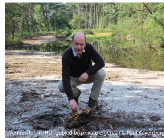
Venherstel in JHD- gebied bij private eigenaar

In het kader van Europese natuurdoelen bij particulieren werden venhabitats, heide en bossen hersteld in Postel en de Grote Neerheide op de grens van Lichtaart en Herentals. Zo slaagden we er samen met particuliere eigenaars in ook een deel van de Europese natuurdoelen te realiseren, naast de inspanningen van de overheid en terreinbeherende verenigingen.